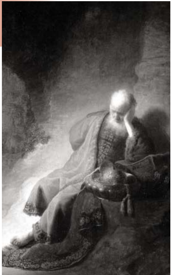
De profeet Jeremia Rembrandt

Zorgvuldig hebben de 'paarse' kabinetten zich de afgelopen jaren van ideologische veren ontdaan, maar tot hun verbijstering bleek het niet te leiden tot een samen-